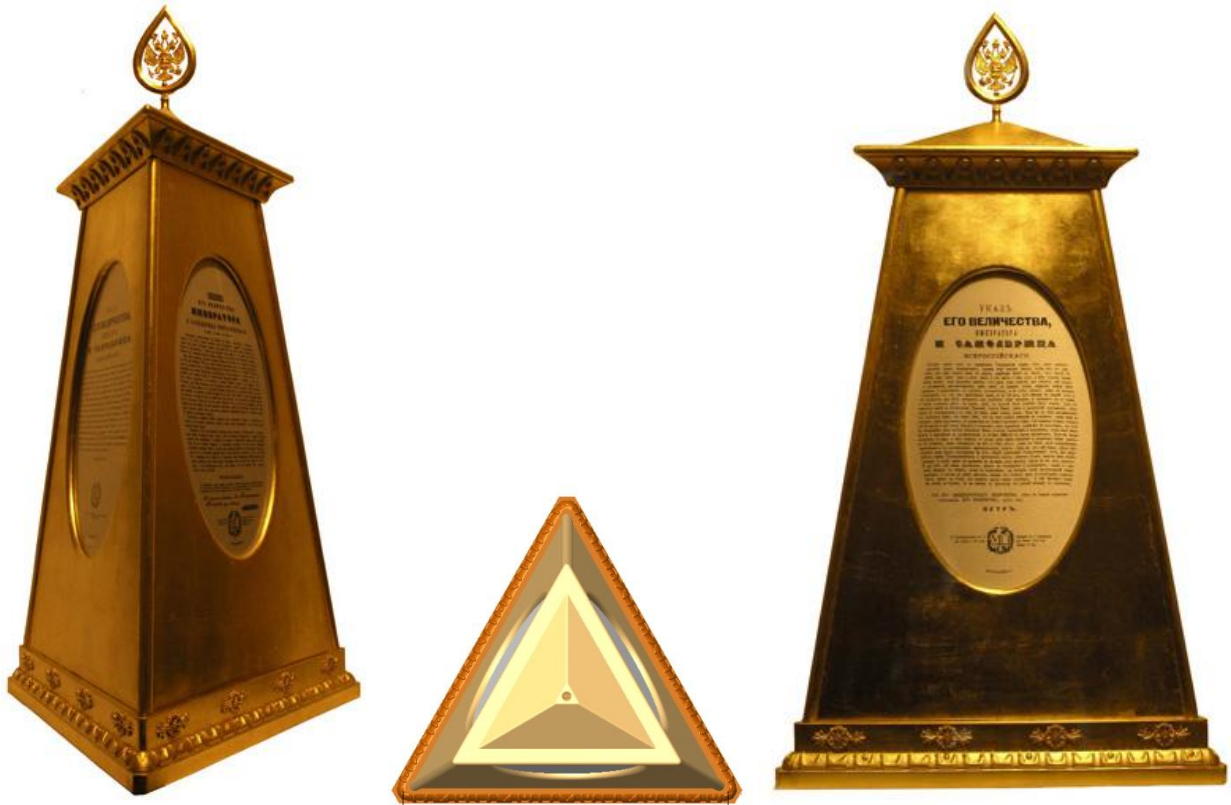
Фото бр. ....б., в, и г: Сlike Зерцала (које је стајало у време цара Петра Великог у свакој судској сали и «присуственом месту/државној канцеларији»),

Зерцало, па и оно у судским сала Петровске Русије јесте Коло , као што је несумњиво и оно у Лепенском Виру, што се види са оклопа првог руског цара из династије Романових Михаила Фјодоровича Романова (1596 – 1645), на којем је круг у васкрсном кретању.