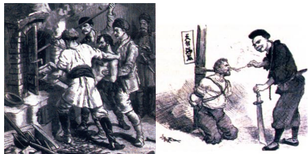
Правосуђе признањем 6

Овај облик процеса и опредељења истинитости устења/изУшћеног значајно се разликовао од испитивања правичности захтева у којем се правда вршила признавањем ходањем по врућем камењу, проласка кроз ватру, бацањем у воду, спуштањем руке у кипућу воду итд.