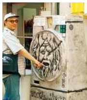
Пула: Уста истини (Galia CisAlpina 8 )

Традиционално «словенско» схватање устења (као изговарања божанске истине) ипак је очувано али незнатно искривљено и у споменицима око којих је исплетена легенде: