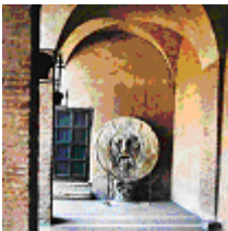
Рим: Восса della Verità Santa Maria in Cosmedin 7

Право и календар очито нису били доступни Латинима. За Латине реч Календе су била страна реч јер је то једна од две речи која је исписивана са почетним словом К.